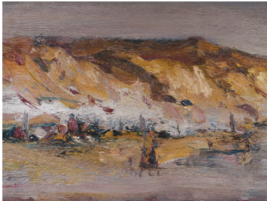
Μακρής Αθανάσιος, Ταπίο , 2015, λάδι σε ξύλο, 36X74 εκ. (λεπτομέρεια)