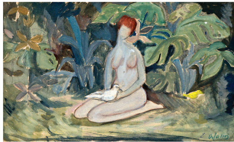
Μουρέλλου - Ορφανού Έλλη, Composition , 1955-'70, Ακρυλικά σε χάρντμπορντ, 24x36,5 εκ.