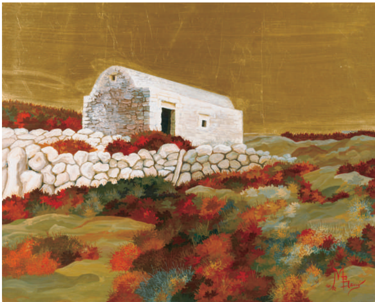
Βενιός Μάρκος, Σίκινος , 2017, αυγοτέμπερα σε ξύλο, 40x50 εκ.

Βενιός Μάρκος, Δημακοπούλου Τζούλια, Κοντογιαννοπούλου Λήδα, Κότσαρης Μιχάλης, Κτιστοπούλου Μαρία, Λουκάς Γιάννης, Μακρής Αθανάσιος, Μαστραντώνης Γιάννης, Μουρέλλου - Ορφανού Έλλη, Ορφανός Λάμπρος, Παπαδοπεράκη Ασπασία, Σιμάτος Χρίστος, Σφήκα Μπαρμπαρέλλα.