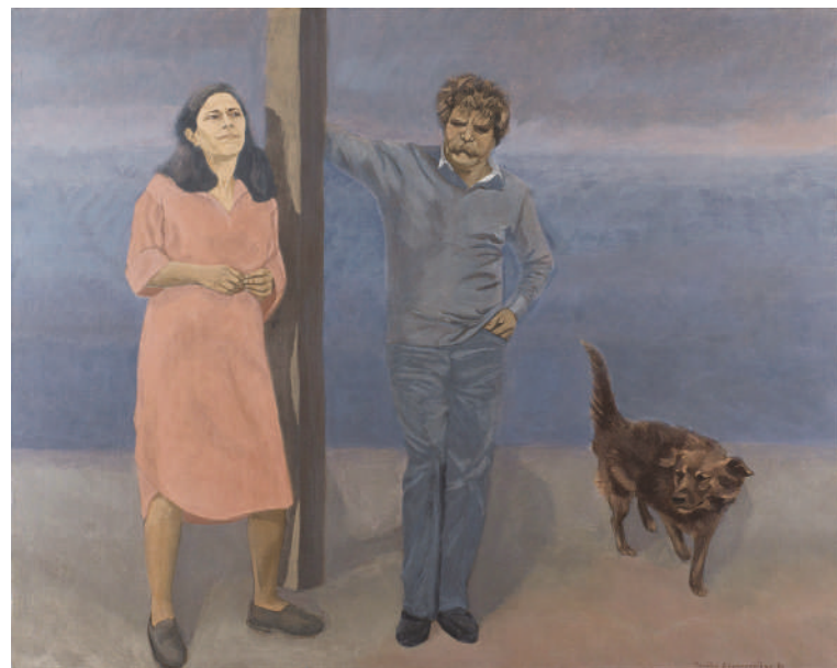
Δημακοπούλου Τζούλια, Χωρίς τίτλο , 1980, Ακρυλικά σε καμβά, 120x150 εκ.

Λήδα Κοντογιαννοπούλου, Δίπτυχο II , 2012, λάδι σε καμβά 120x30 εκ.