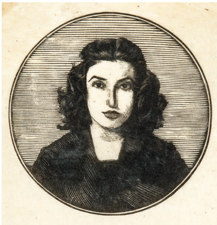
Λάμπρος Ορφανός, Η Έλλη , Αθήνα, 1940-41 Ξυλογραφία σε όρθιο ξύλο, μελάνι σε χαρτί, διάμετρος 7,5 εκ.