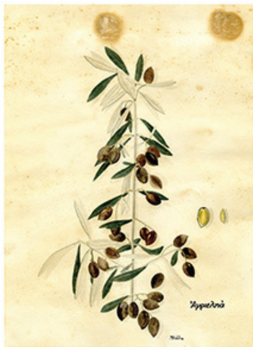
Ακουαρέλα σε χαρτί, 31x23 εκ., Συλλογή Γεωργικού Μουσείου