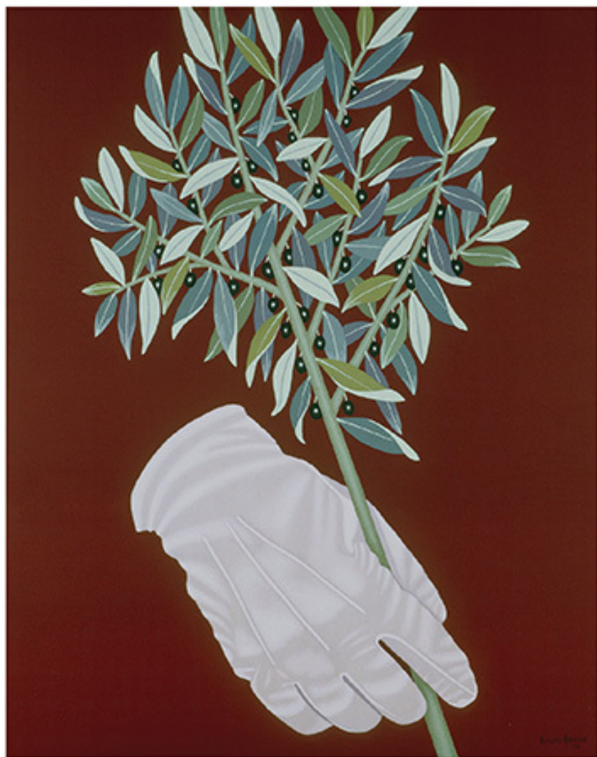
Κλάδος ελαίας, 2004, Αυγό σε ζωγραφικό χαρτί εφαρμοσμένο σε τελάρο με κόντρα πλακέ, 110x90 εκ., Συλλογή του καλλιτέχνη