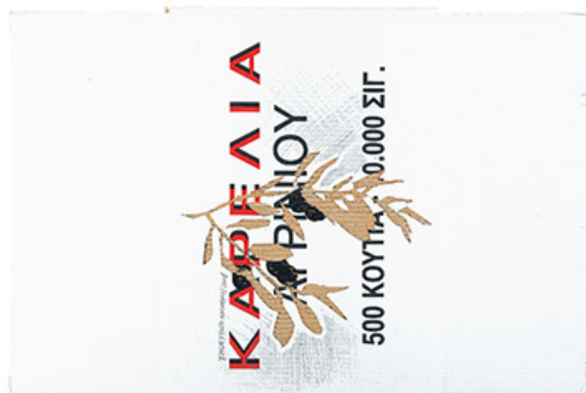
Κλαδί ελιάς, 2008, Μικτή τεχνική, 50x73 εκ., Συλλογή του καλλιτέχνη