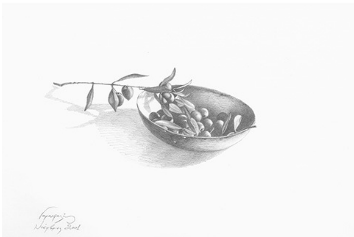
Κλαδάκι ελιάς σε τάσι, 2001, Μολύβι σε χαρτί, 28x39εκ., Ιδιωτική συλλογή