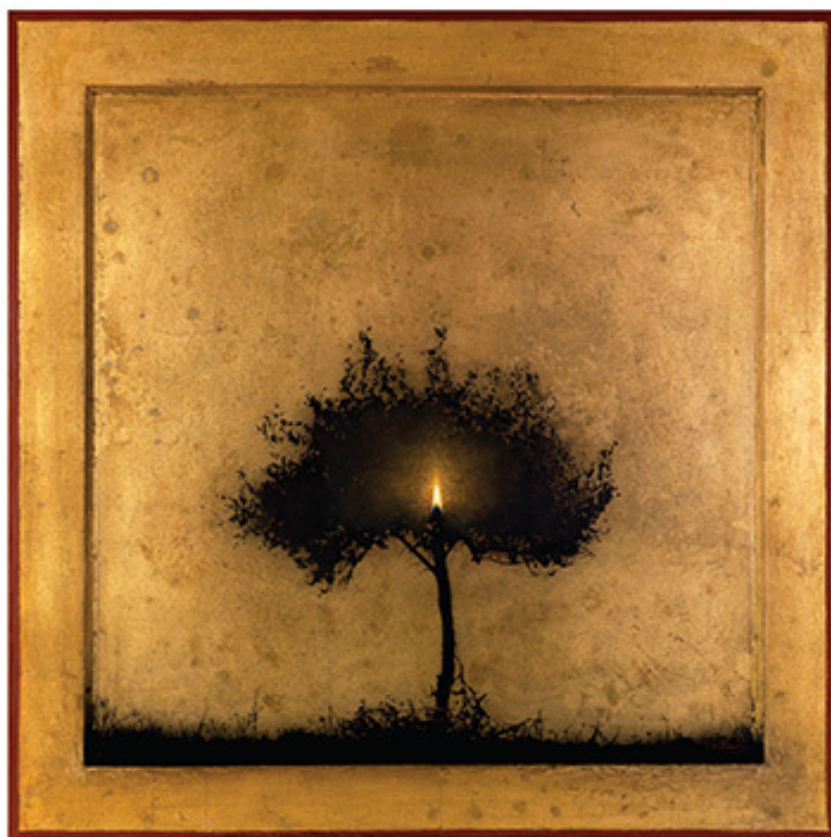
Σκό ελιάς καντήλι, Σκόνες και χρώματα λαδιού σε χρυσωμένο ξύλο, 65x65 εκ., Ιδιωτική συλλογή