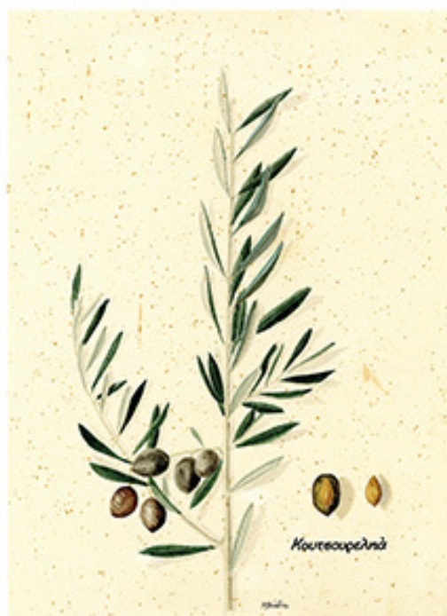
Ακουαρέλα σε χαρτί, 31x23 εκ., Συλλογή Γεωργικού Μουσείου