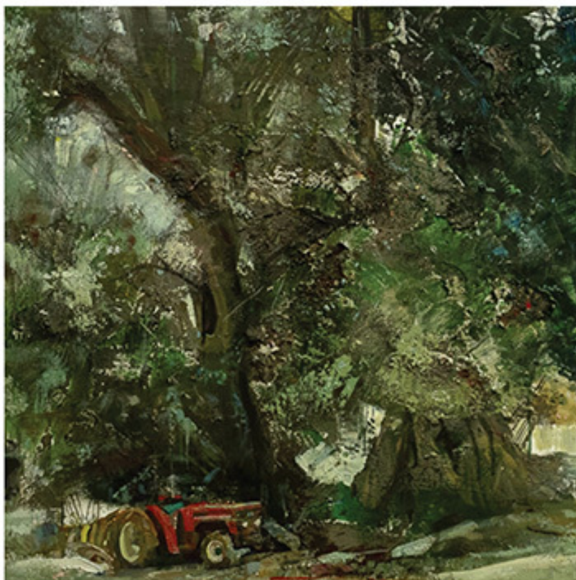
Ελαίνας, Δροσάτο, Βόρεια Κέρκυρα, 2018, Λάδι σε καμβά, 45x45 εκ., Συλλογή του καλλιτέχνη