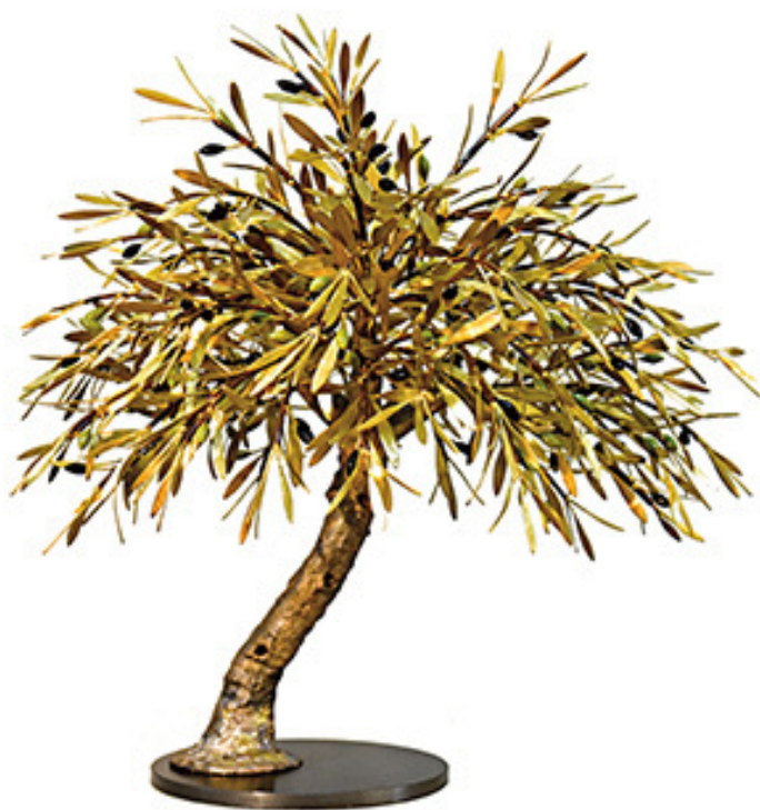
Ελιά - I, Χαλκός, μπρούνιζος, σίδηρος, 50x45x50 εκ. Συλλογή του καλλιτέχνη