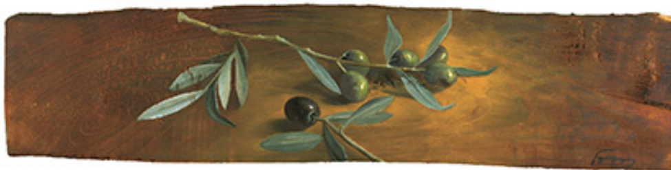
Κλαδάκι ελιάς, Λάδι σε ξύλο, 16x66 εκ., Ιδιωτική συλλογή