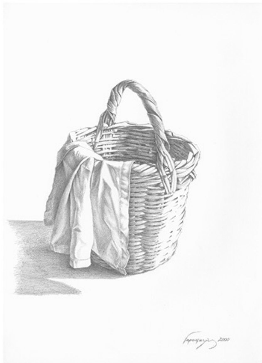
Καλάθι, 2000, Μολύβι σε χαρτί, 39x28εκ., Ιδιωτική συλλογή