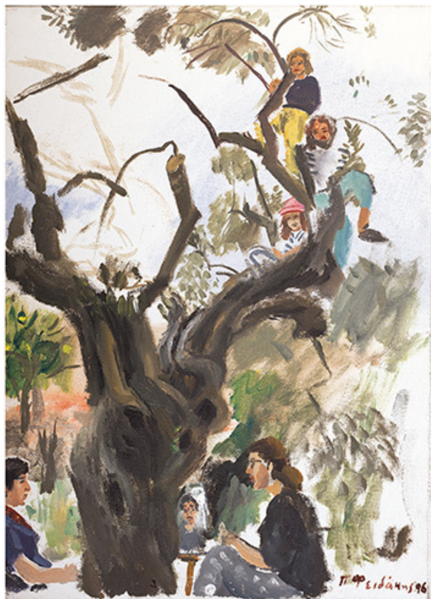
Ελιά, 1996, Λάδι σε μουσαμά, 44x32 εκ., Ιδιωτική συλλογή