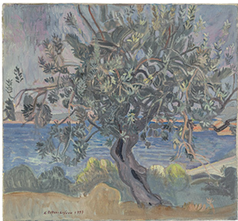
Ελιά, 1997, Ακρυλικό σε μουσαμά, 56x60 εκ., Ιδιωτική συλλογή