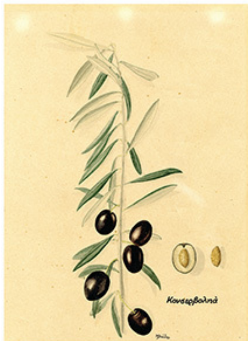
Ακουαρέλα σε χαρτί, 31x23 εκ., Συλλογή Γεωργικού Μουσείου