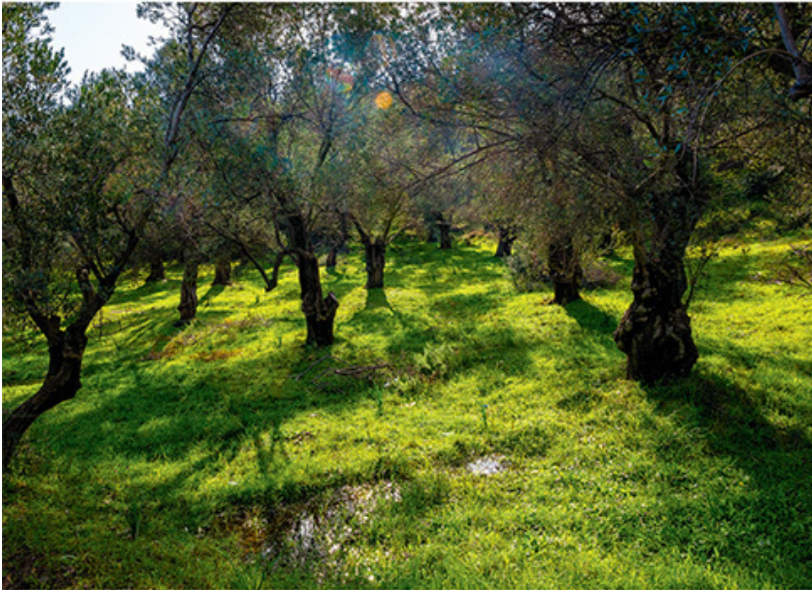
Ελαιώνας με ηλιώδες φως. Φωτογραφία, Χαρτί semimatte 280 γρ., 50x70 εκ., Συλλογή του καλλιτέχνη