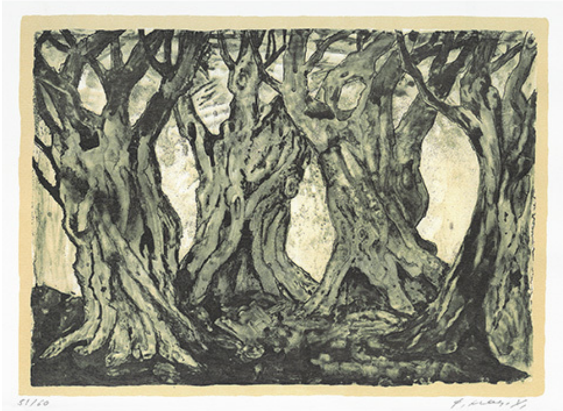
Ελακίνας, Λιθογραφία 51/60, 23X31εκ., Ιδιωτική συλλογή