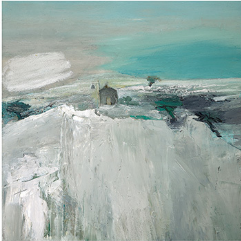
Μικρό ξακλήσι με ελιές, Λάδι σε καμβά, 80x80 εκ., Συλλογή της καλλιτέχνιδας