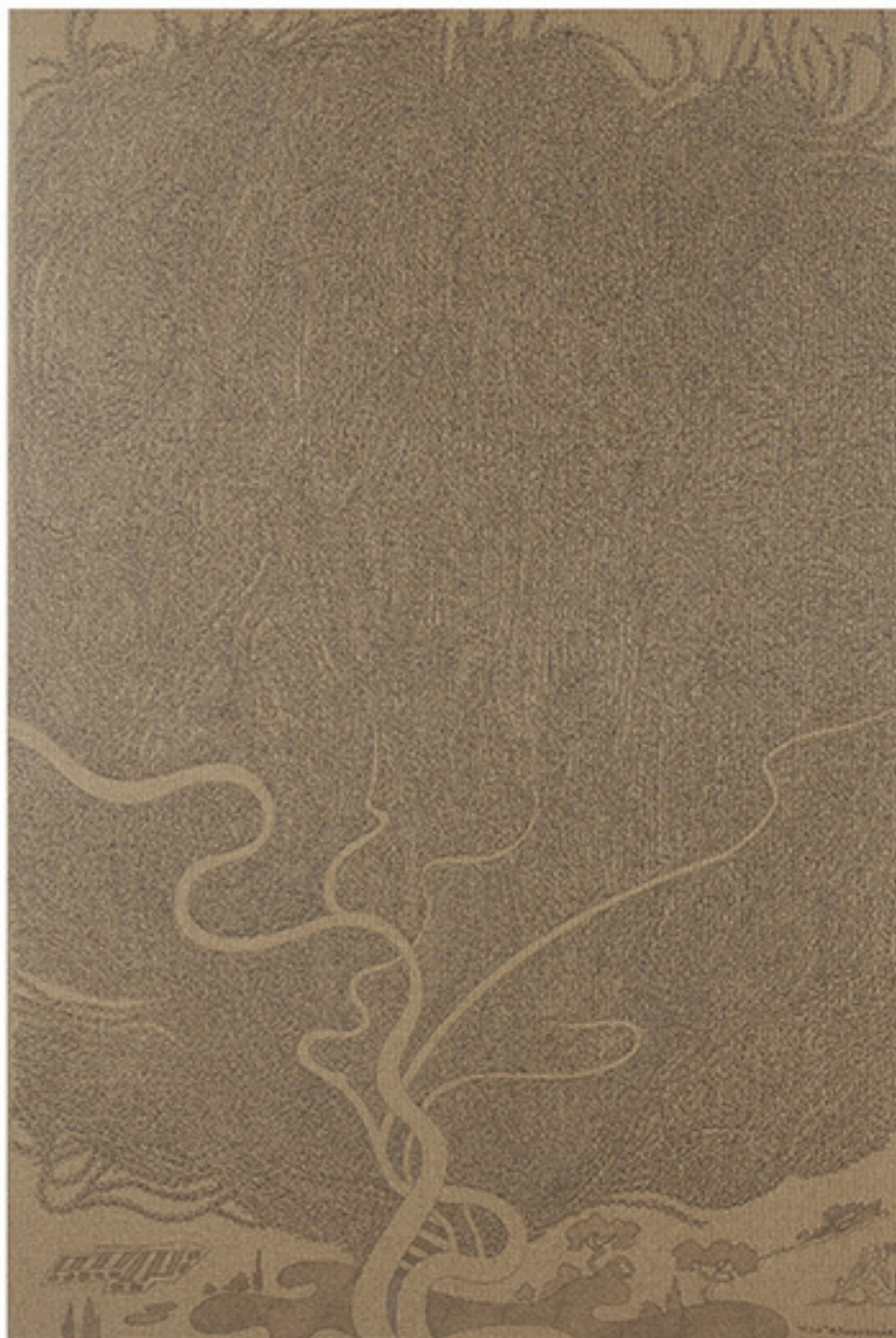
Ελιά, 2008, Μολύβι σε καρβά, 120x80 εκ., Συλλογή του καλλιτέχνη