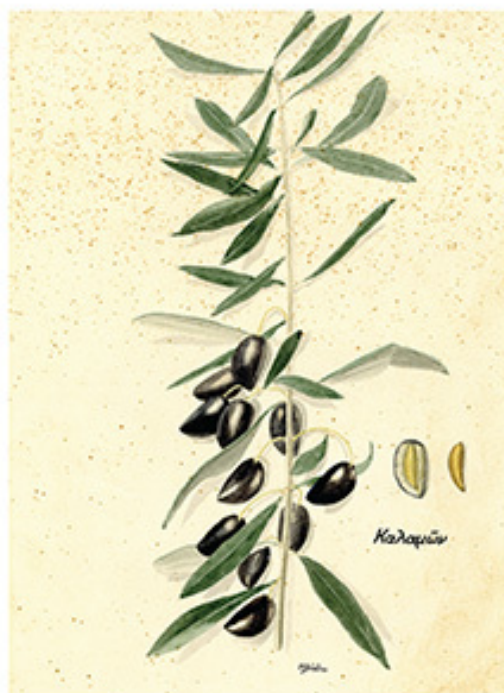
Ακουαρέλα σε χαρτί, 31x23 εκ., Συλλογή Γεωργικού Μουσείου