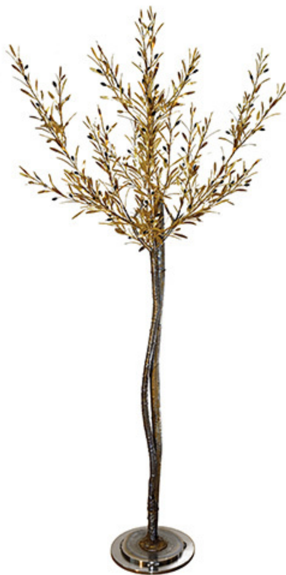
Ελιά - II, Χαλκός, μπρούτζος, σίδηρος, 60x60x130 εκ., Συλλογή του καλλιτέχνη